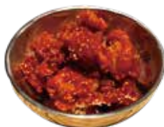
ヤンニョムチキン 780 양념치킨 (858)