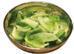
チョレギサラダ 720 초레기 샐러드 (792)