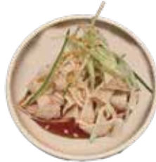
白センマイ刺し 480 화이트 센마이 사시미 (528)