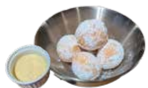
チーズボール 750 (ハニーマスタード付き) 치즈볼 (825)