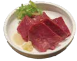
和牛ハツ刺し 480 와규 하츠사시미 (528)