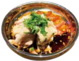
よだれ鶏 480 침 흘리는 닭 (528)