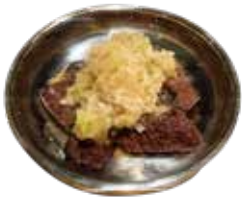
和牛ふぞろいレバー 780 와규 모듬 간 (858)