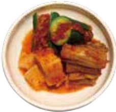
キムチ盛り 480 김치 모듬 (528)