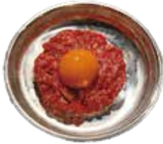
和牛ローストビーフ 1350 와규 로스트 비프 (1,485)