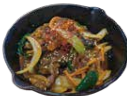
チャプチェ 980 채볶이 (1,078)