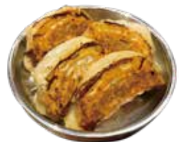
コリアン焼餃子 (4個) 580 코리안 군만두 (4개) (638)