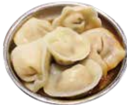
コリアン水餃子 (6個) 580 코리안 물만두 (6개) (638)