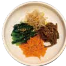
ナムル盛り 520 나물 모듬 (572)