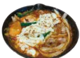
チーズタッカルビ 980 치즈닭갈비 (1,078)