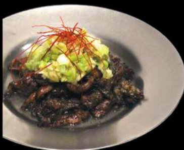
親鳥セセリ炙り焼き