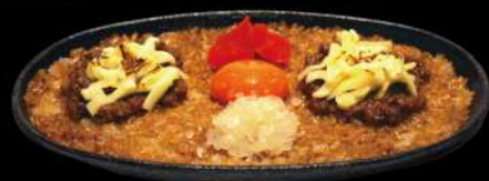
キーマカレーチーズ