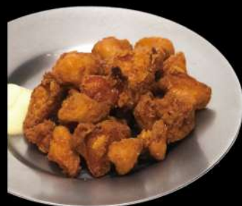
親鳥ほんじり唐揚げ